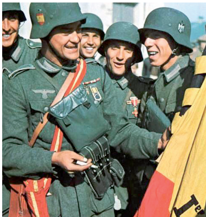
FONT: División Azul , 1941.